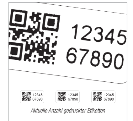
Ultra hohe 600 x 1200 dpi Auflösung durch Microschritt-Antriebstechnik