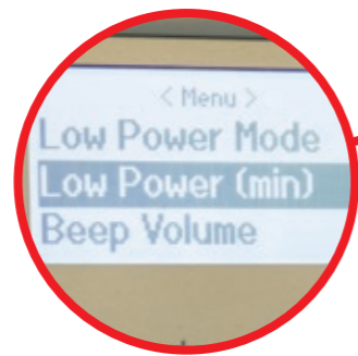
Benutzerfreundliche und informative, große LCD Anzeige