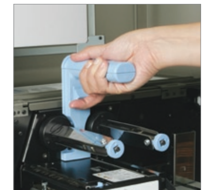
Ein vertikal anhebbarer Kopf für einfachen Zugang