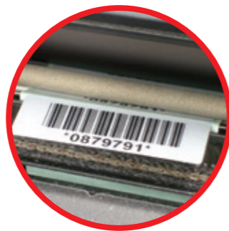
Faszinierende Spendemodule, die schon mit Etiketten von gerade einmal 10 mm Höhe arbeiten